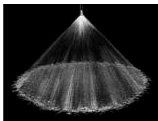
Cono lleno 90°