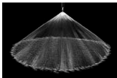
Cono lleno 120°